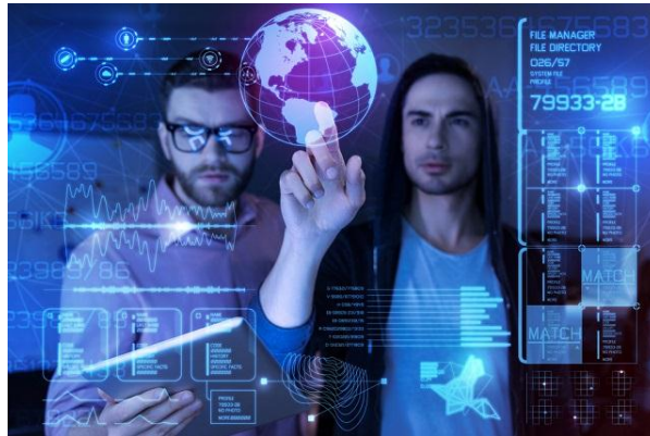
Com as mudanças tecnológicas nos setores produtivos, novas modalidades de trabalho surgem.

O Setor Quaternário da economia abrangeria trabalhos como a geração e troca de informações, as atividades da área da educação, pesquisa e desenvolvimento, bem como a alta tecnologia.