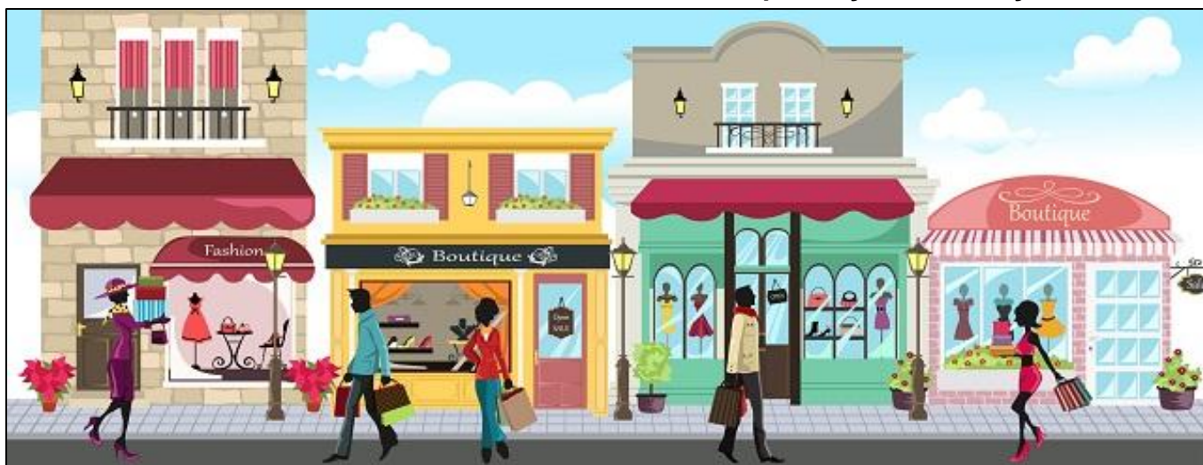
O comércio faz parte do Setor Terciário da economia e é o que mais gera empregos.

São atividades do Setor Terciário: o comércio e a prestação de serviços.