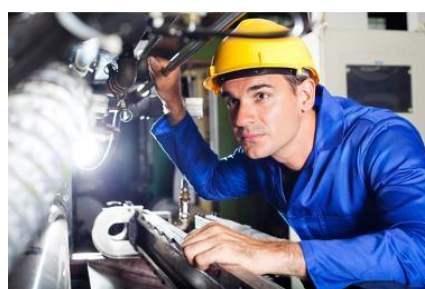
Imagem 02 Operador trabalhando